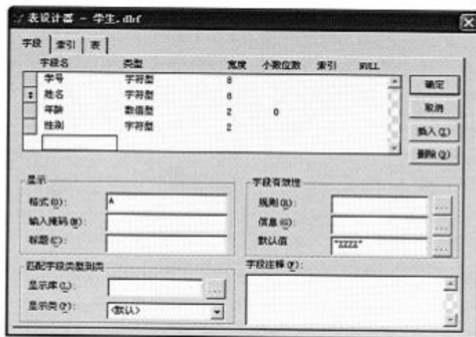
题 41 图

请依照上述方式，分 5 步描述用数据库表设计器的“字段有效性规则”控制“年龄”字段取值范围的步骤。7-224